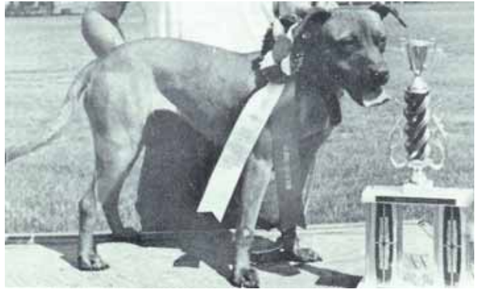
1977 - Pitrman's "Penny" - Best of opposite sex