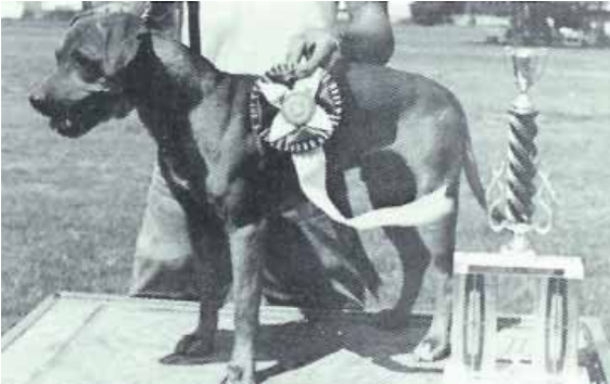
1977 - Havnes' "Red Ike" - Best of Show